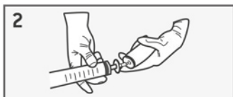
innestare l'insieme siringa-filtro sull'adattatore montato sulla bomboletta