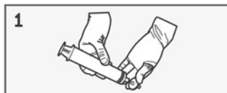
connettere il filtro alla siringa