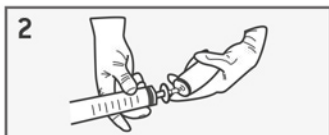
innestare l'insieme siringa-filtro sull'adattatore montato sulla bomboletta