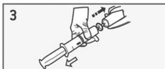
spingere la siringa contro la bomboletta per riempirla con una adeguata quantità di gas